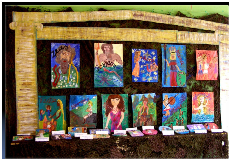
Świat Starożytnej Grecji