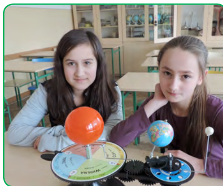
Szkoła Podstawowa nr 9, Tarnów