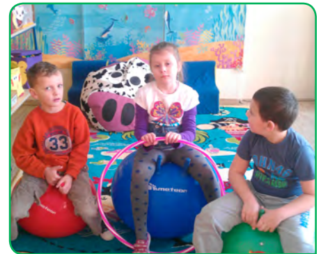
Szkoła Podstawowa nr 12, Mielec