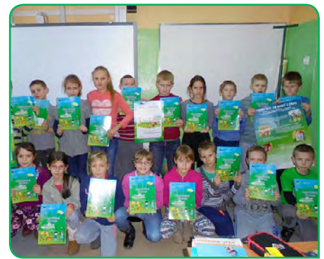
Szkoła Podstawowa, Drzycim