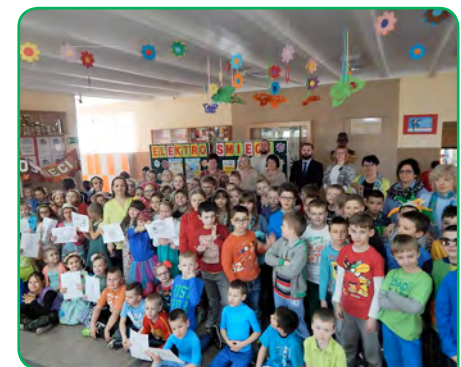
Szkoła Podstawowa nr 79, Poznań