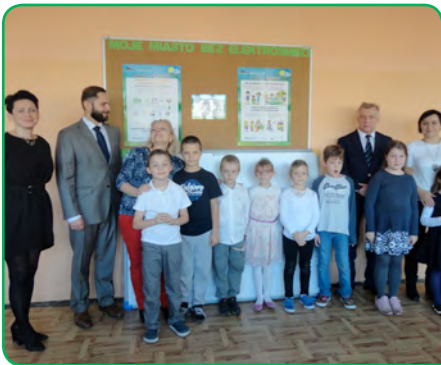
Szkoła Podstawowa nr 66, Poznań