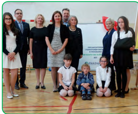
Szkoła Podstawowa nr 127, Warszawa