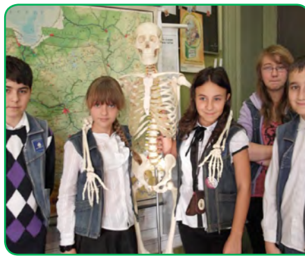
Szkoła Podstawowa nr 4, Legnica