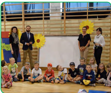
Szkoła Podstawowa, Złotoria