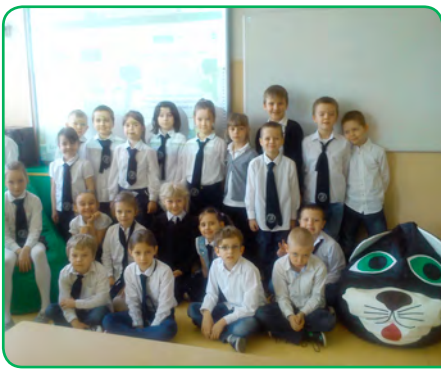
Szkoła Podstawowa nr 255, Warszawa